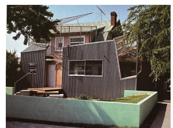
Gehry, USA, 1978